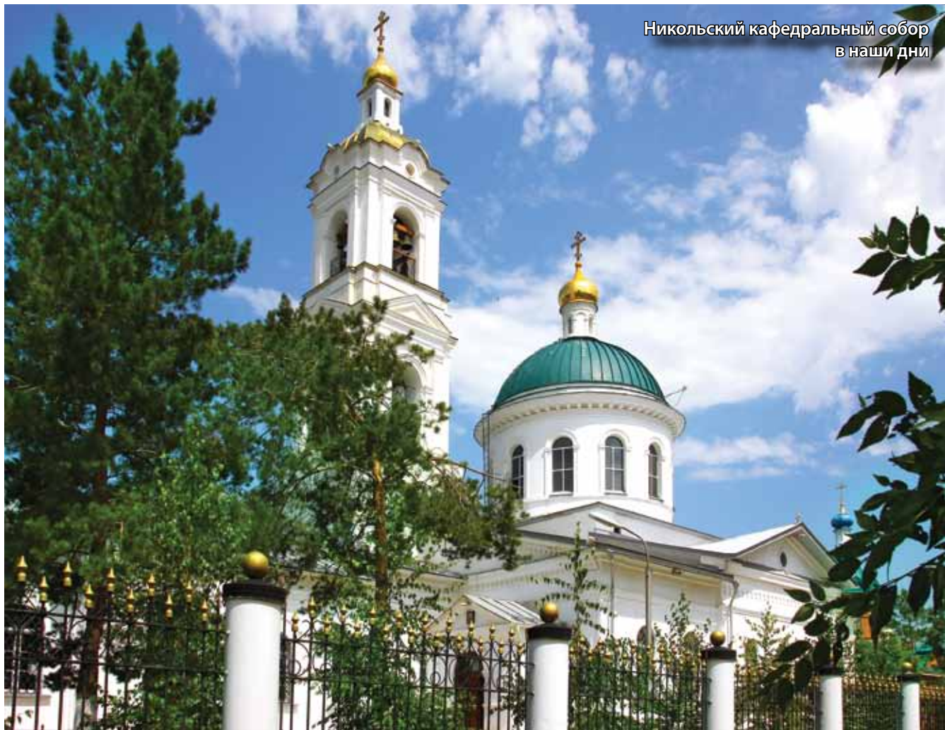
Никольский кафедральный собор в наши дни

В описании колокола говорится: «По кругловатому верхнему краю корпуса – полоса рельефного стилизованного растительно-цветочного орнамента в отдельных суженных кверху мотивах. Под ним среди трех двойных рельефных черт – надпись „рок АХЧШ“ (1699). Под надписью – широкая полоса густого роскошного акантового рельефного мотива. Ниже – рельефный ряд ангельских головок с крыльями, связанными в одну орнаментную зубчатую полосу. На середине корпуса – выпуклые изображения птицы со сложенными крыльями и надписью „голубь“. С противоположной стороны в роскошном барочном картуше – надпись в три ряда: „Карпъ Иосифович Делатель“. Между изображением птицы и надписью в картуше на всю ширину корпуса колокола, врезаясь в полосу из ангелов, – рельефный образ Воскресения. Симметрично к нему с противоположной стороны, также нарушая зубчатую полосу ангелов, – большой рельефный герб в виде перевернутой буквы с т.н. вилчатым завершением и короткой поперечной чертой. Со сторон вертикальной черты – полумесяц и шестиугольная звезда. Вокруг – буквы: I. С. М. Г. В. Е. Ц. П. В. З. Герб – на