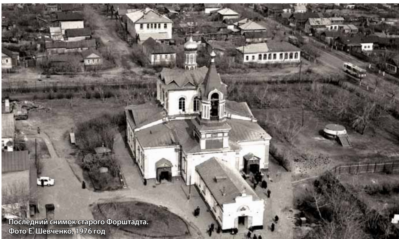
Последний снимок старого Форштадта. 1976 год

Известно несколько мастерских произведений самого Карпа Балашевича, разбросанных по всему миру: фрагмент крупнокалиберной пушки Батурина, сплошь украшенный чеканным растительным орнаментом с точками среди полос (в центре – роскошный литой картуш и та же подпись: «Карпъ Иосифович Делатель»); пицаль 1697 года для города Конотопа с подписью: «за счастливого регимента ясно велможной милости пана Ивана Мазепы гетмана...»; мортира весом в 50 пудов; большая, роскошно украшенная, в густой растительной рамке с титулами Петра I и гетмана Мазепы пушка из коллекции трофеев Московского Кремля.