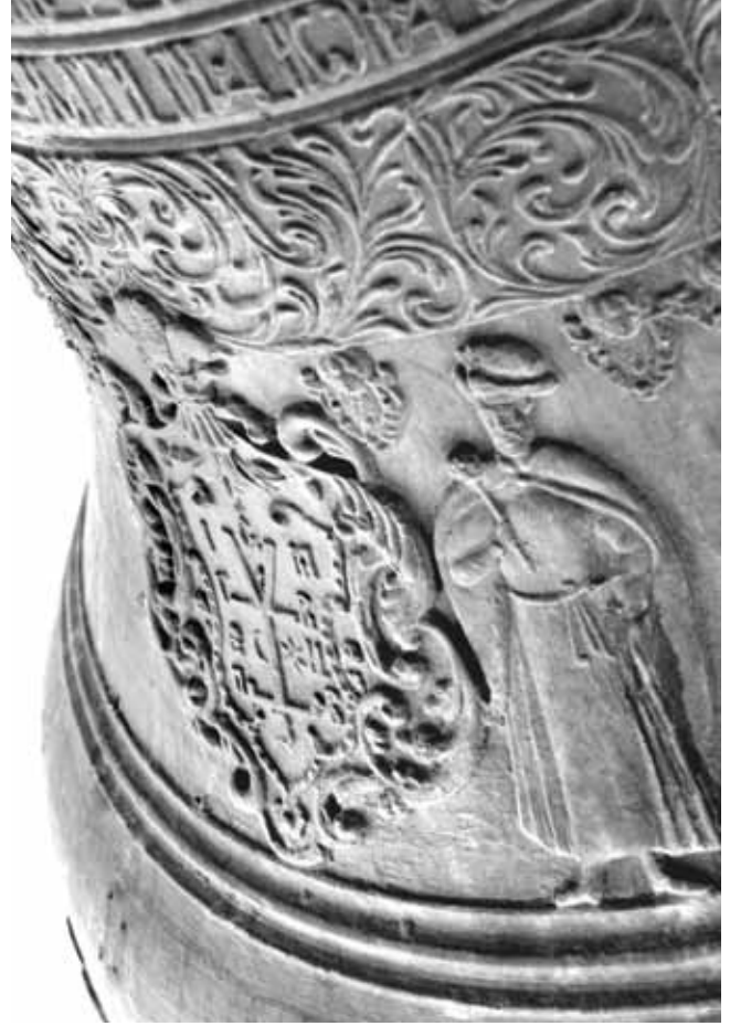
Фигуры голубя и гетмана с булавой доказывают, что найден именно утерянный колокол «Голубь»

фестонированном щите, окруженном роскошным барочным картушем со шлемом и перьями. Рядом с гербом с правой стороны – фигура во весь рост, одетая в жупан, длинный плащ, в широкой шапке, с саблей на боку. Левая рука опирается на бедро, правая – держит булаву».