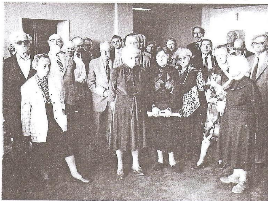
Курс 1936-41 г.в. в день презентации книги "Голоса из мира, которого уже нет" на историческом факультете, перед Доской памяти.