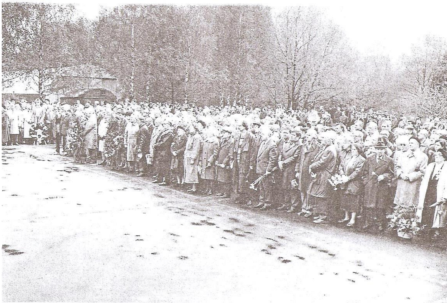
Сотрудники и выпускники Московского университета у Вечного огня. Май 1995 г.