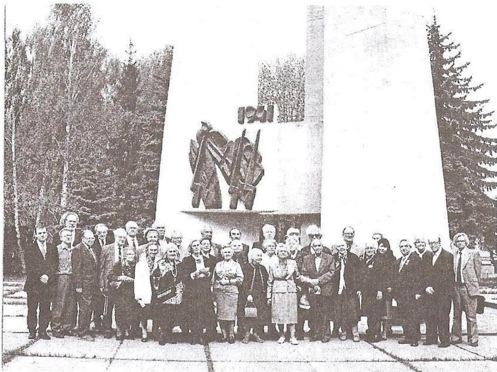
В день презентации книги "Голоса из мира, которого уже нет." 1995 г. - у Вечного огня перед I-м корпусом гуманитарных факультетов.