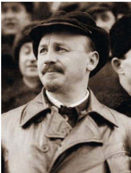
Николай Иванович Бухарин 1927 [РГАСПИ. Ф. 56. Оп. 2. Д. 58. Л. 98]

терна Зиновьева, хотя так и не сменил того на посту Председателя ИККИ.