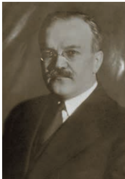
Вячеслав Михайлович Молотов 1930-е

Проработка Эдварда Прухняка, члена Политбюро ЦК компартии Польши (КПП) и члена Президиума ИККИ, в ходе которой использовались подобные аргументы, завершилась прямой угрозой: мы пять лет возились с Троцким, «пока наконец не выкинули его из партии и не арестовали, как врага коммунизма» 1 .