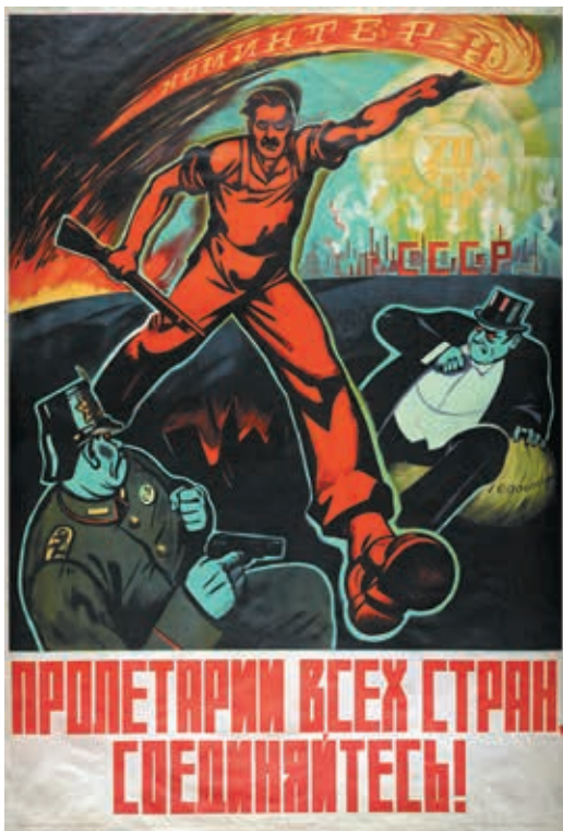
В советской пропаганде Коминтерн и СССР были неотделимы друг от друга. Плакат к XII годовщине Октября 1929

двумя мирами), ибо для российских большевиков это выглядело как принижение собственного статуса.