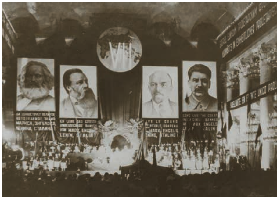
Открытие Седьмого конгресса Коминтерна 25 июля 1935 [РГАСПИ. Ф. 494. Оп. 2. Д. 6. Л. 1]

данным. Его деятельность отражала новый (последний) этап жизни международной организации коммунистов, который характеризовал переход отдельных компартий к большей организационной и политической самостоятельности, что диктовалось установками антифашистской борьбы, в том числе и в условиях германской оккупации.