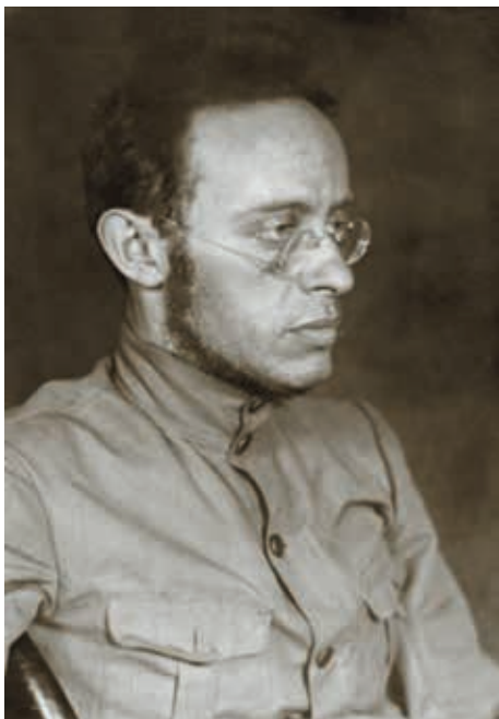
Карл Бернгардович Радек 1920

компартии (КПП), Радек был арестован, и весть о создании Коминтерна добралась до него уже в берлинской тюрьме Моабит.