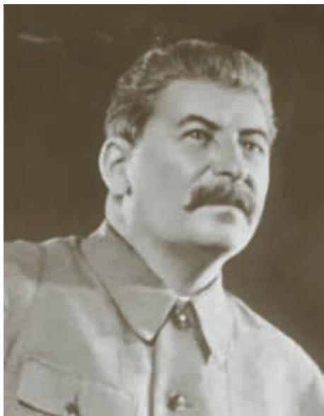
Иосиф Виссарионович Сталин 1937 [РГАСПИ. Ф. 558. Оп. 11. Д. 1650. Л. 20 об.]