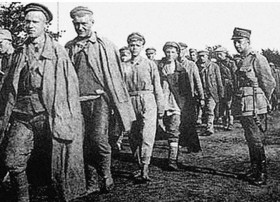
Колонна пленных красноармейцев. Польша

Совершенно естественно, что тяжелые условия жизни в заведениях для пленных и рабочих командах, голод, холод, болезни были