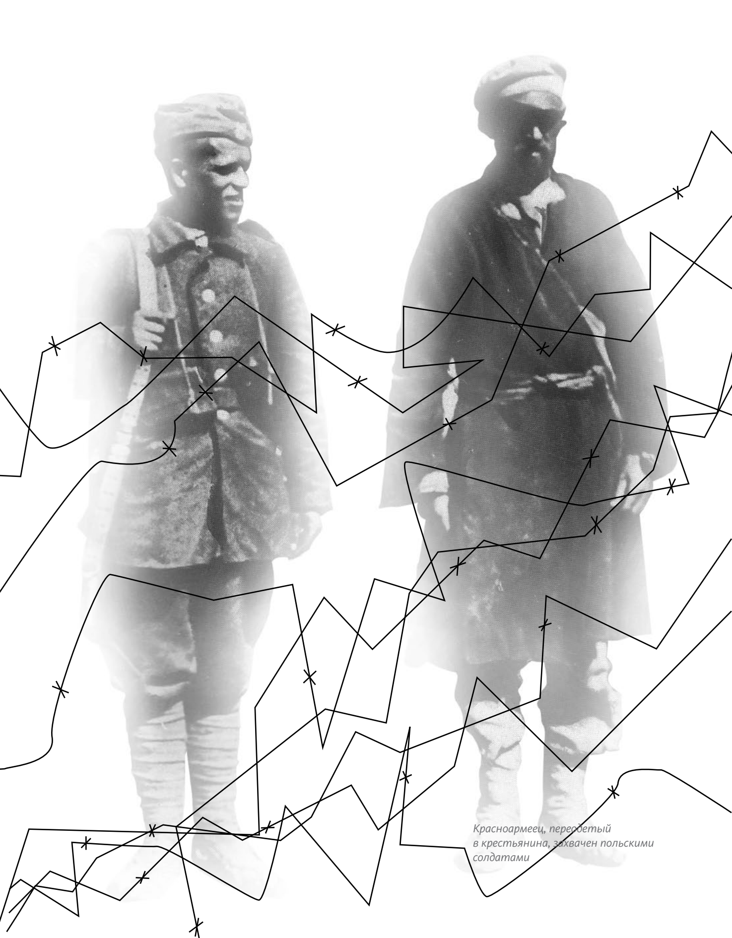
Красноармеец, переданный в крестьянина, захвачен польскими солдатами