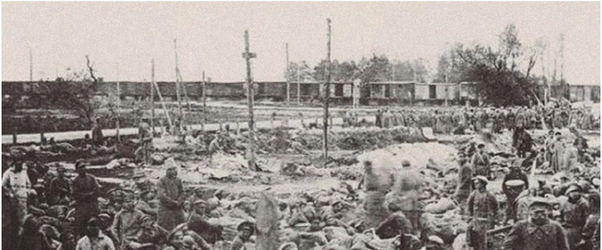
Концентрационная станция для красноармейцев. Октябрь 1920 г.

после пленения, еще до постановки на учет, а кого-то даже отпустили, чтобы не выделять солдат для их охраны и конвоирования в тыл. Других включили в так называемые дикие (т.е. созданные без разрешения военного министерства) рабочие команды и оставили во фронтовых частях – их судьба туманна. Очень многих просто расстреляли без суда и следствия. Прежде всего расстреливали комиссаров,