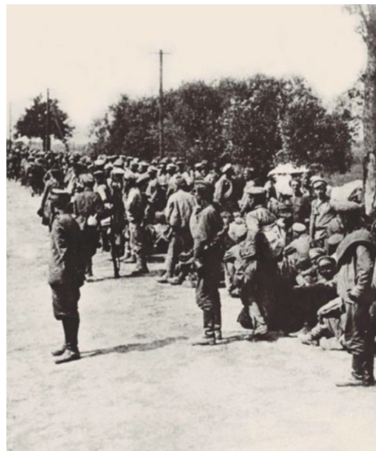
Пленные красноармейцы на проселочной дороге. Польша

и причем существенная, и пусть виновные в этом покаются – это неповоротливость и безразличие, пренебрежение и невыполнение своих прямых обязанностей...» Конечно, были и объективные трудности со снабжением продовольствием и одеждой, топливом и лекарствами. Но ведь Польша не переживала пандемий инфекционных заболеваний и всеобщего голода. В трагедии польского плена явно просматривается вина тех, кто по долгу службы должен был эту трагедию всеми силами предупреждать. А вместо этого они фактически продолжали с пленными свою личную войну, без угрызений совести и чувства христианского милосердия обрекая своих беззащитных подопечных на холод, голод, болезни и мучительное умирание.