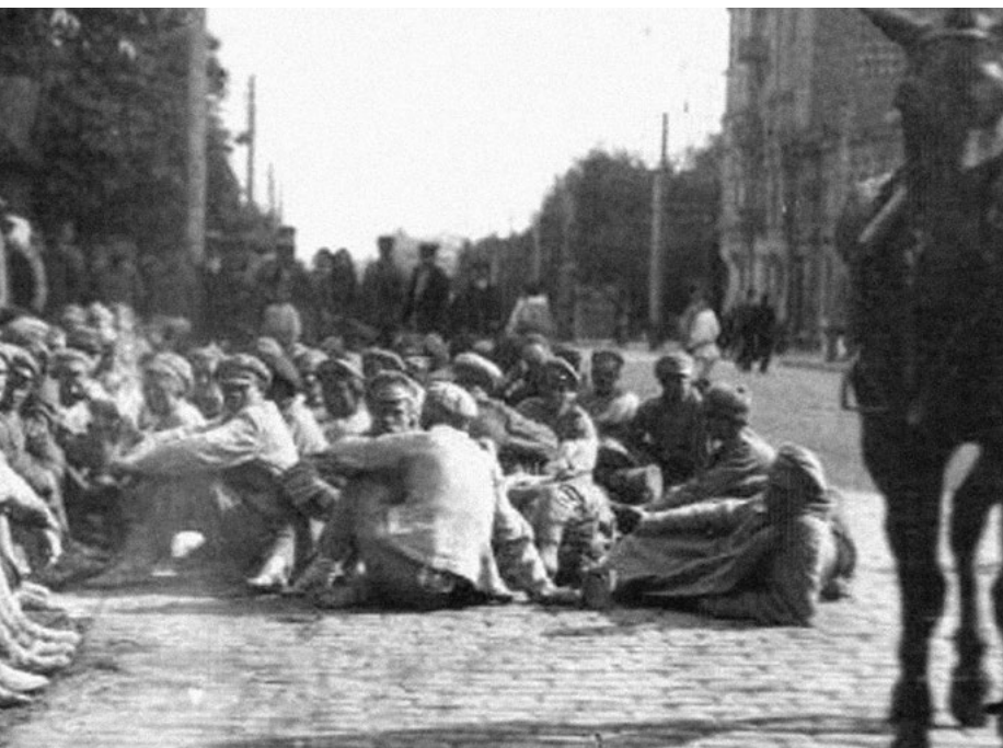
Пленные красноармейцы. Август 1920 г.

Путь пленных от фронта до стационарного лагеря был непростым и опасным. Вначале пленных, уже раздетых и ограбленных, отправляли на сборные пункты для постановки на учет, а также на условное денежное и продовольственное довольствие. Затем были распределительные и пересыльные пункты, располагавшиеся в прифронтовой полосе. Условия содержания в них были невыносимыми. Вот как описывал в 1919 г. ситуацию на сборной станции Молодечно заместитель начальника санитарной службы Литовско-Белорусского фронта майор Хакбейль: «Лагерь при сборной станции для пленных – это был настоящий застенок. Никто об этих несчастных не заботился, ничего удивительного, что человек неу-