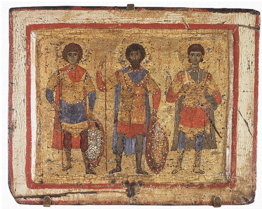
7. Свв. Георгий, Феодор и Димитрий. Конец XI — начало XII в. Государственный Эрмитаж, С.-Петербург