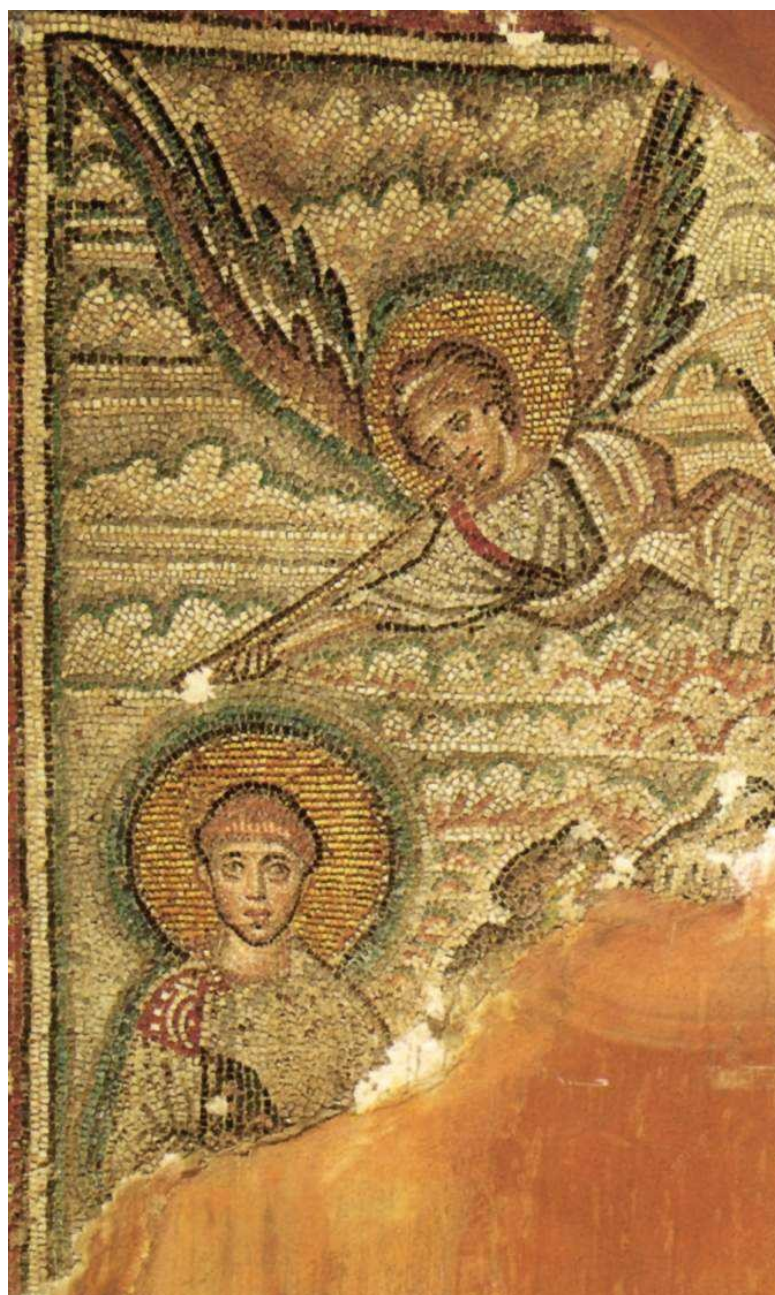
3. Св. Димитрий. Мозаика. VII в. Храм св. Димитрия. Салоники, Греция ([Бутырский М.Н.] Византийское искусство. Электронное издание (CD-ROM). М.: DirectMEDIA, 2006)