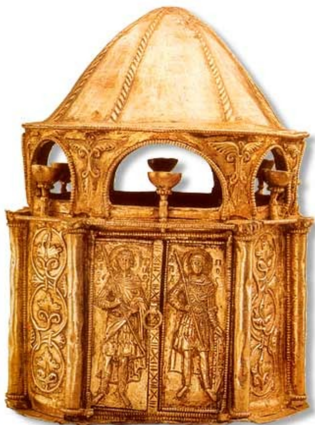
6. Реликварий св. Димитрия. 1059–1067 гг. Московский Кремль (Православная энциклопедия. Т. 15. М., 2007 [доступно 25.05.2016: http://www.pravenc.ru/text/178231.html ])