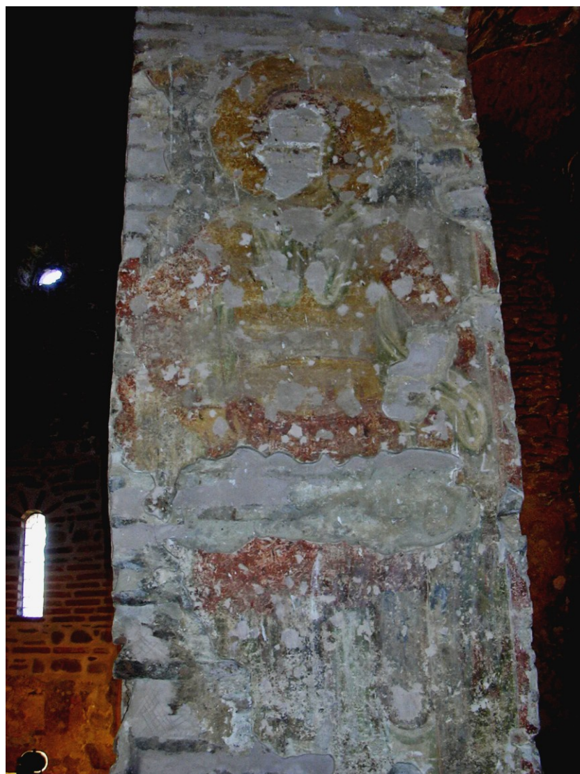
13. Св. Димитрий (?). Фреска. Конец XII в. Храм св. Димитрия. Паталеница, Болгария