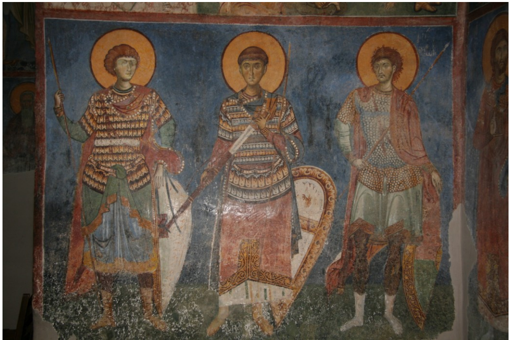
9. Свв. Георгий, Димитрий и Феодор Тирон. Фреска. 1164 г. Монастырь св. Пантелеймона. Нерези, Македония*