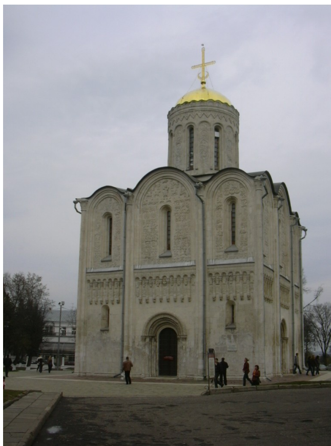
14. Собор св. Димитрия. Ок. 1194 г. Владимир-на-Клязьме, Россия