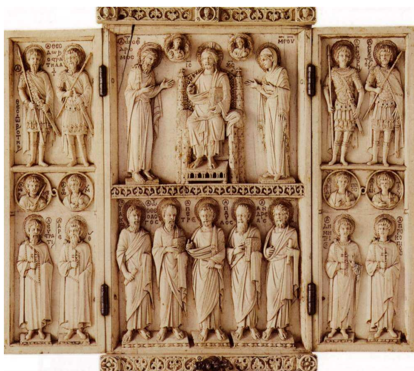
5. Арбаวิลล์ский триптих. Слоновая кость. Середина XI в. Лувр, Париж ([Бутырский М.Н.] Византийское искусство. Электронное издание (CD-ROM). М.: DirectMEDIA, 2006)