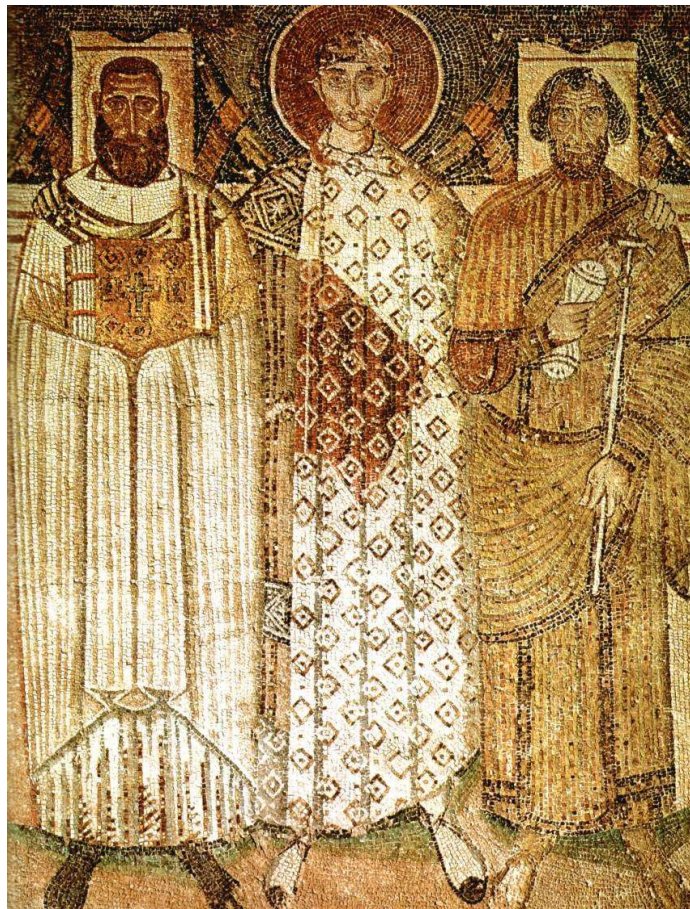
4. Св. Димитрий с префектом и неизвестным диаконом. Мозаика. 670-е — 680-е гг. Храм св. Димитрия. Салоники, Греция ([Бутырский М.Н.] Византийское искусство. Электронное издание (CD-ROM). М.: DirectMEDIA, 2006)