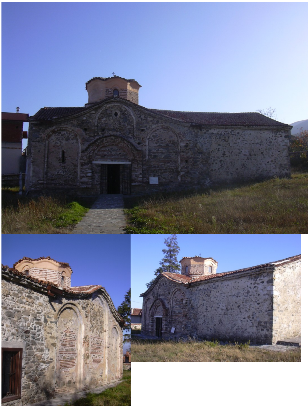
10–12. Храм св. Димитрия. XI–XII вв. Паталеница, Болгария