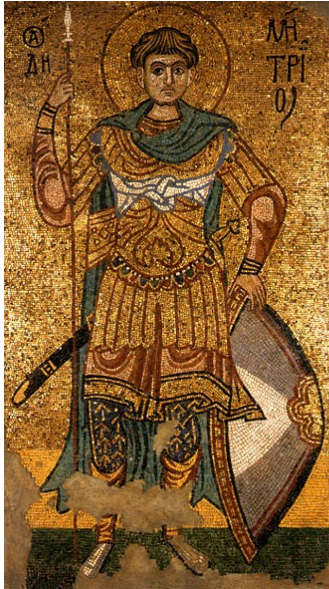
8. Св. Димитрий. Мозаика Михайловского Златоверхого монастыря. Киев. Ок. 1108 г. Государственная Третьяковская галерея, Москва («Христианство в искусстве: иконы, фрески, мозаики» [доступно 25.05.2016: http://www.icon-art.info/masterpiece.php?lng=ru&mst_id=657 ]