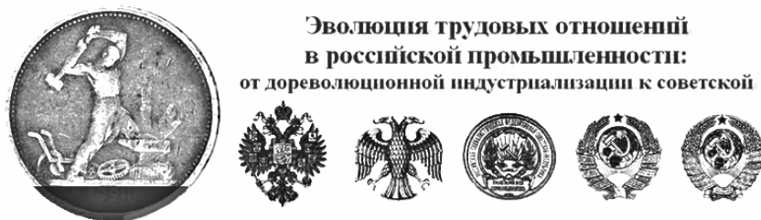
Рис.1. Фрагмент стартовой страницы проекта

Уже в 2003 г. данный тематический ресурс стал наиболее представительным по количеству и качеству информации о социальной истории рабочих российской промышленности в период индустриализации (включая обе ее фазы — дореволюционную и советскую). Число обращений к сайту проекта достаточно велико: так, за первые шесть месяцев 2006 г. это число превысило 4400.