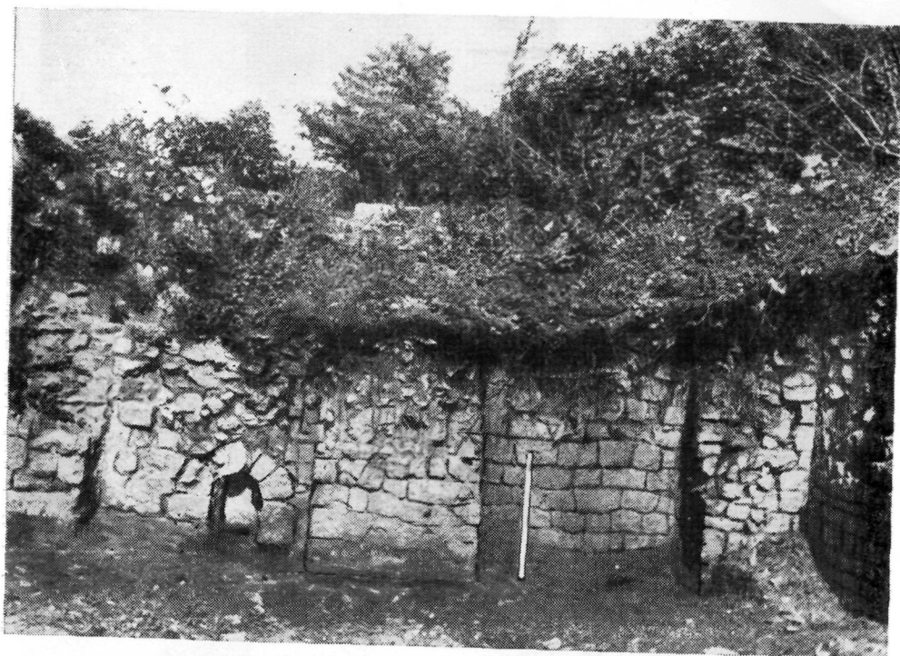
Рис. 28. Восточная часть цистерны 2