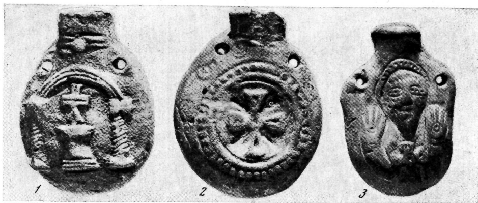
Рис. 4. 1. Ампула: мученик Иоанна Богослова. Эфес; 2. Ампула: мученик епископа Тимофея (?). Эфес; 3. Ампула: апостол Петр. Эфес