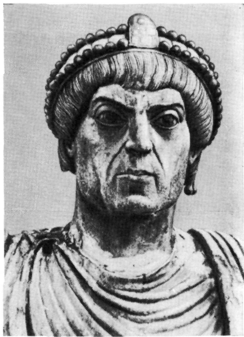
Рис. 18. Император Маркиан. Голова бронзовой статуи. Барлетта. Церковь св. Сеполкро