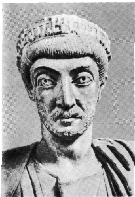
Рис. 17. Император Феодосий II. Мрамор. Париж. Лувр