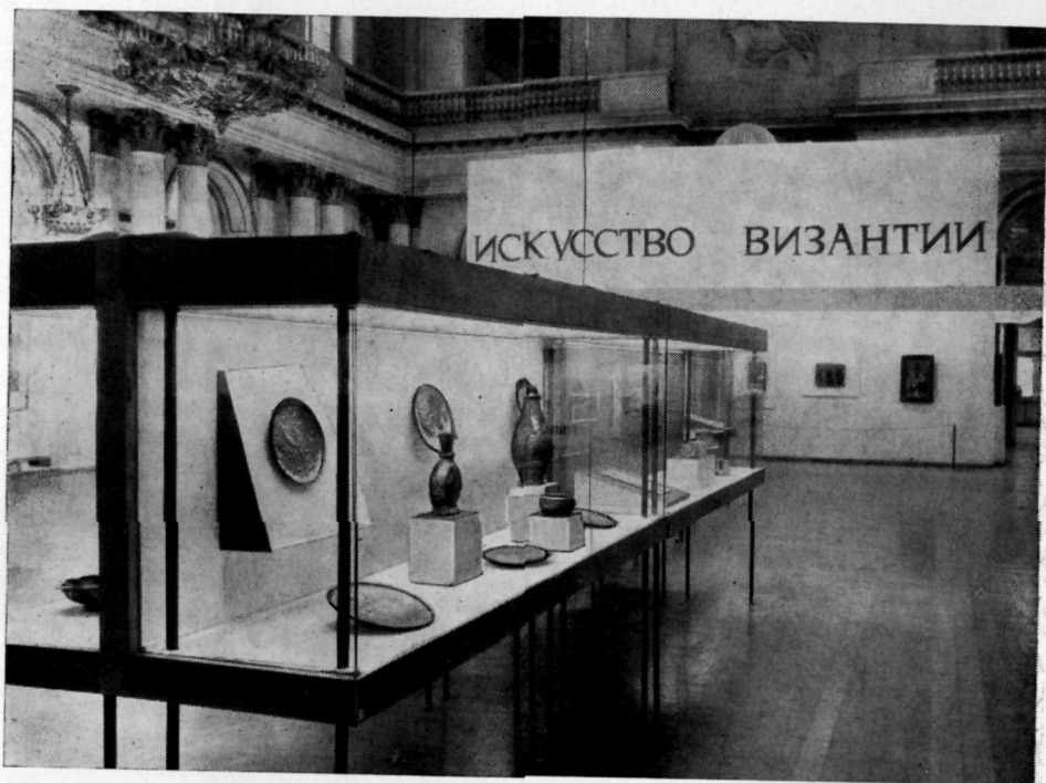
Рис. 1. Гос. Эрмитаж. Общий вид первого зала выставки.