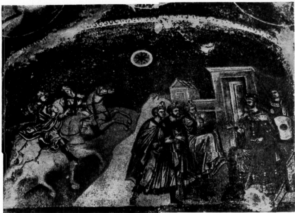
Мозаика церкви Спасителя на Хоре (Кахриэ-джами), изображающая волхов перед Иродом.