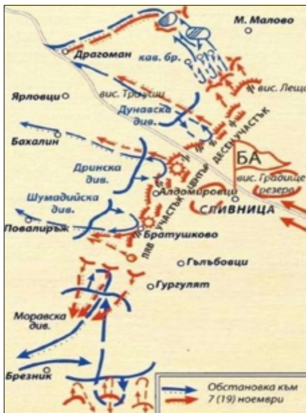
Бой у Сливницы