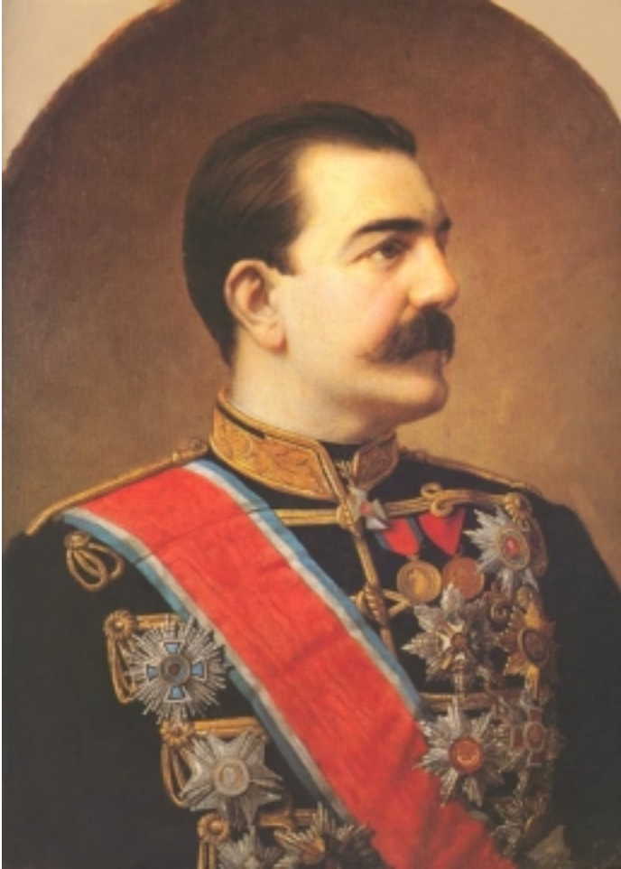
Король Сербии Милан I Обренович