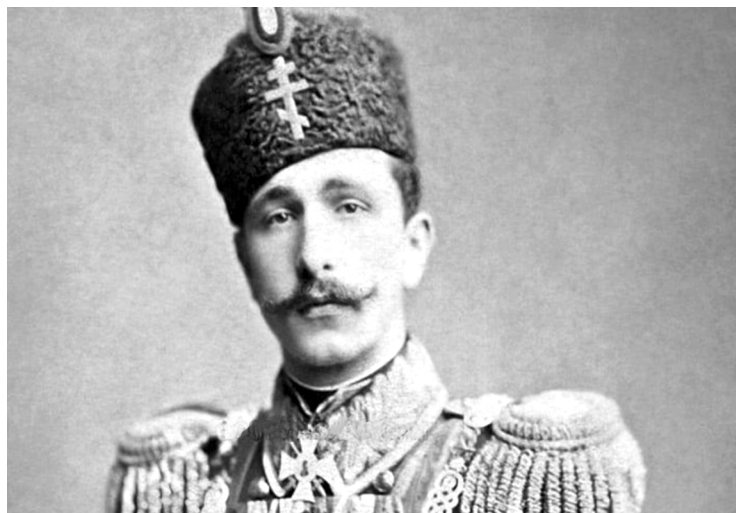
Князь Болгарии Александр Баттенберг

условиям Берлинского трактата для создания новых государственных органов Болгарии и налаживания общественной и государственной жизни в стране было введено русское гражданское управление, которое первые девять месяцев полностью управляло страной. Создавались губернии, организовывалось народное войско, решались вопросы организации просвещения и т.д.