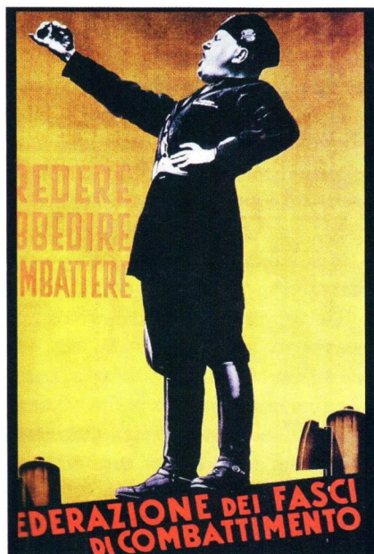
Итальянский агитационный плакат 1935 года

Характер вступления Италии и в Первую, и во Вторую мировую войну был обусловлен именно этим. Ведь мы знаем, что Италия, будучи членом Тройственного союза, в итоге выступила на