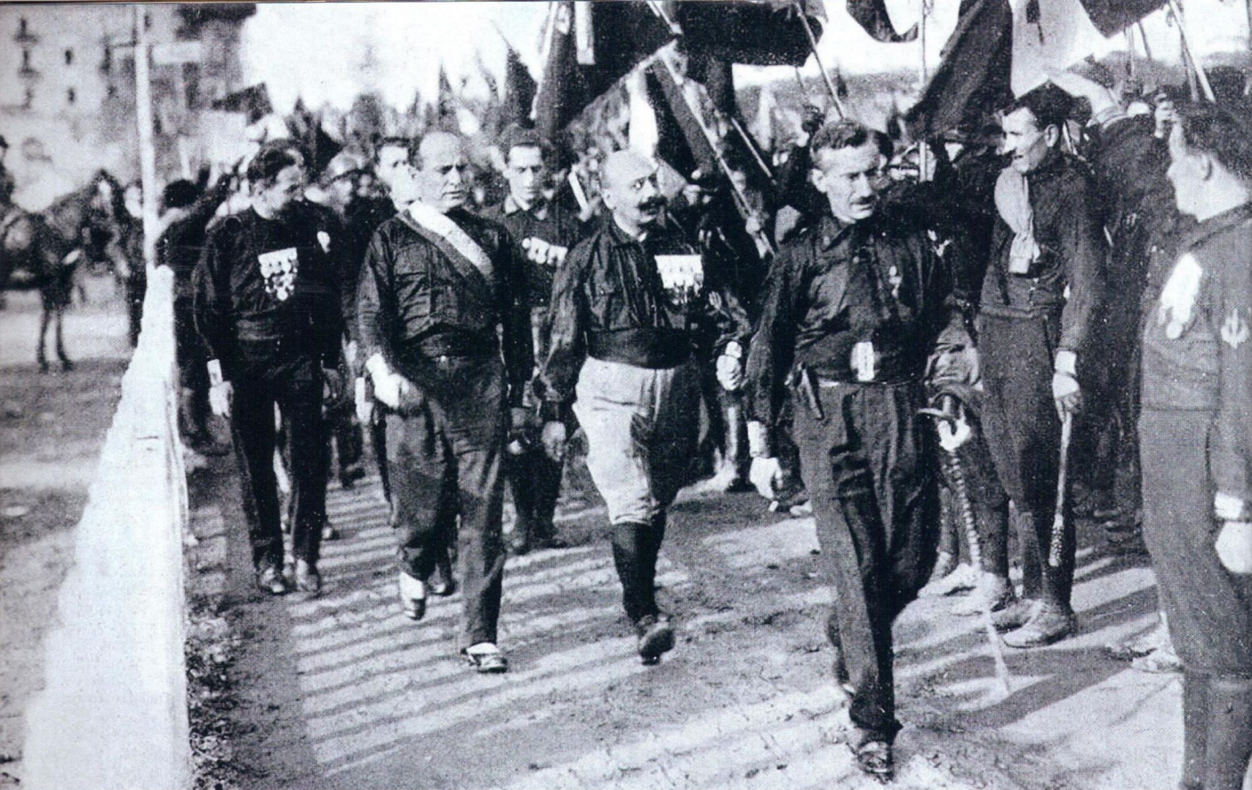
«Поход на Рим». Бенито Муссолини (впереди первый слева) среди чернорубашечников. Октябрь 1922 года

других ограничений. Конечно, евреи очень сильно ущемлялись в правах, но не более того. В Италии расовые законы были приняты под давлением Гитлера уже после того, как Муссолини годом ранее сделал свой выбор