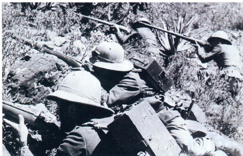
Итальянские солдаты в Эфиопии. 1935 год

– Такая трактовка вопроса мне представляется правильной. Во-первых, фашизм в условиях революционного подъема рассматривал коммунизм как реального оппонента, поскольку массовая социальная база у них была примерно одна и та же (хотя коммунисты поначалу делали ставку лишь на рабочий класс, а потом уже на крестьянство, а фашисты пытались одновременно воздействовать эти слои населения, в том числе средние слои города и деревни). Во-вторых, носители фашистской идеологии видели в коммунистах реальных бойцов. Они понимали, что коммунисты, так же как и они сами, стремятся захватить власть, опираются на массы и при этом прямо противо-