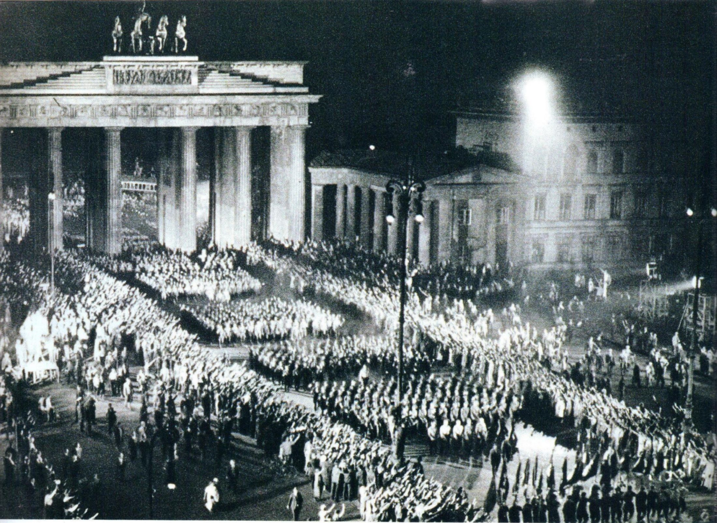
Факельное шествие нацистов через Бранденбургские ворота в день назначения Адольфа Гитлера на пост рейхсканцлера Германии. Берлин, 30 января 1933 года

туннеля: в одном случае это величие нации, в другом – мировой коммунизм. Борьба за массы, за этот новый субъект исторического развития и определила смертельное противостояние фашизма и коммунизма.