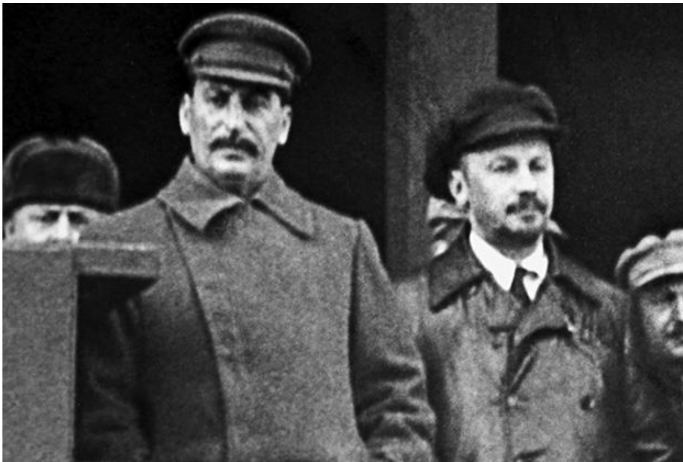
Иосиф Сталин и Николай Бухарин

Бухарин, который в 1929 году внезапно для себя оказался лидером «правой оппозиции», тоже обвинял Сталина в том, что тот стал троцкистом. На самом деле все было сложнее.