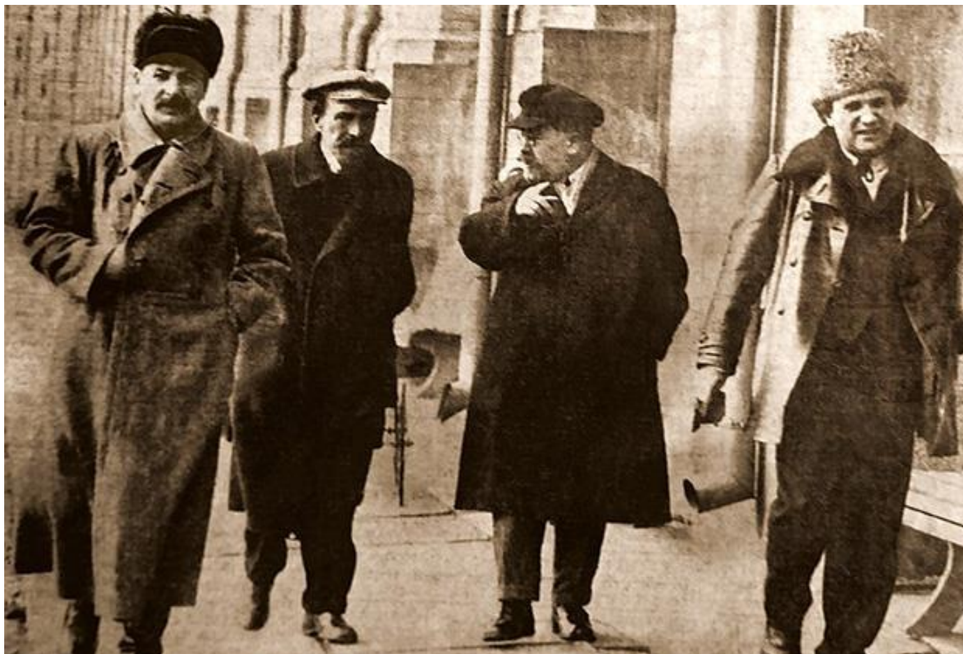
Слева направо: Иосиф Сталин, Алексей Рыков, Лев Каменев и Григорий Зиновьев в 1925 году.