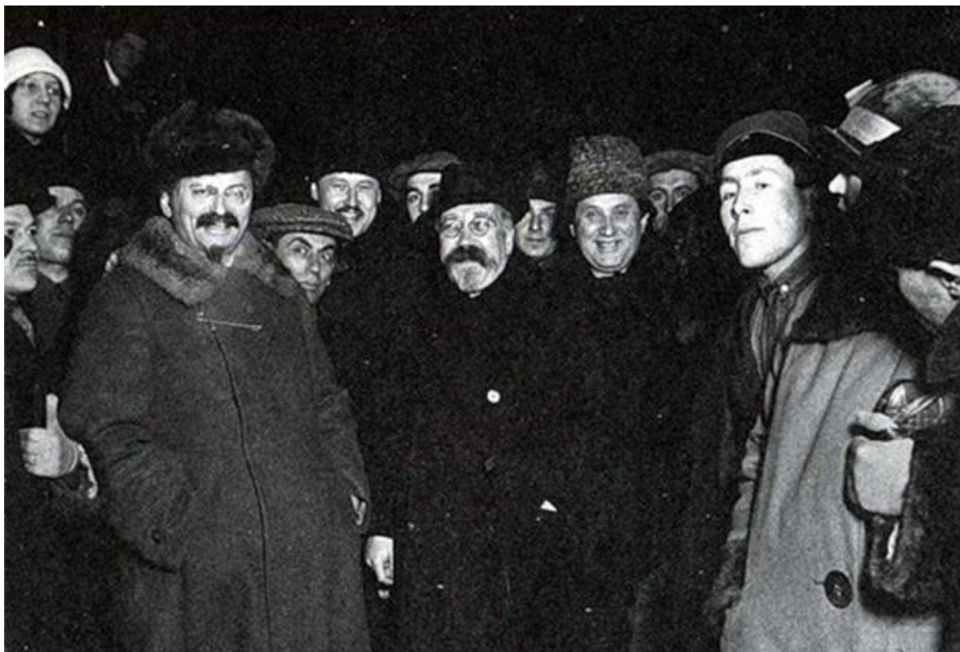
Лев Троцкий, Лев Каменев и Григорий Зиновьев. Середина 1920-х годов. Фото: Wikipedia

«Большой скачок» 1928-1933 годов, со сплошной коллективизацией и ускоренной индустриализацией, концептуально опирался именно на идею построения социализма в одной стране.