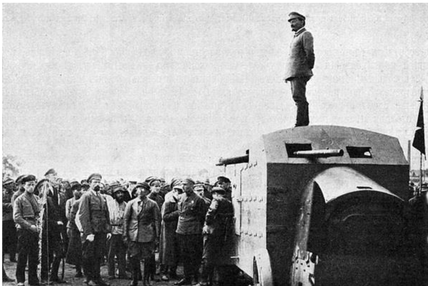
Лев Троцкий в Крыму в 1921 году.

Оппозиция действующей власти существовала даже при большевистском режиме – правда, недолго. Сто лет назад, в начале 1920-х годов, начался постепенный процесс перерождения ленинской однопартийной диктатуры в административно-бюрократический режим единоличной власти Сталина.