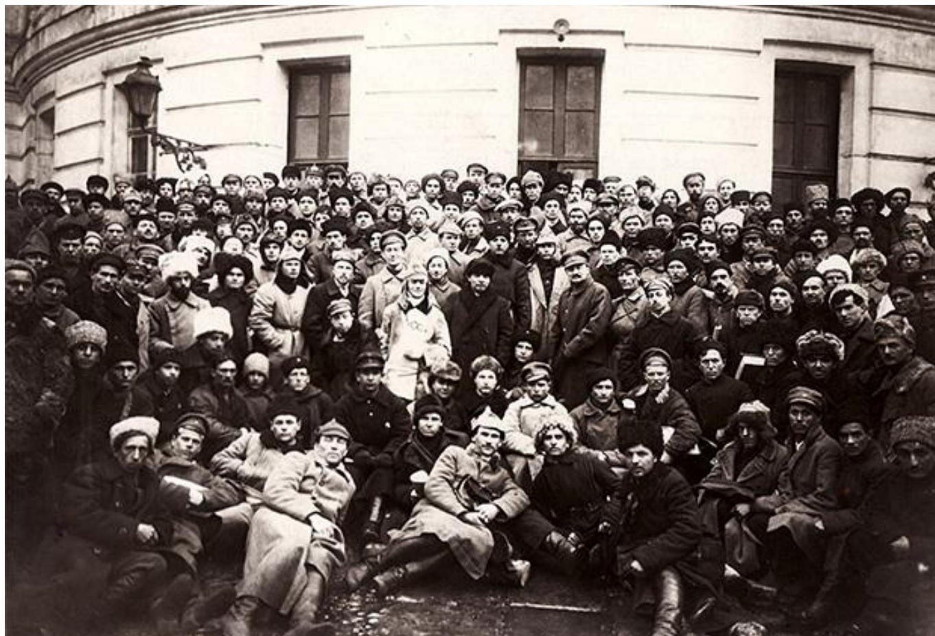
Владимир Ленин, Климент Ворошилов и Лев Троцкий среди делегатов X съезда РКП(б), вернувшихся после подавления Кронштадтского восстания. Март 1921 года.