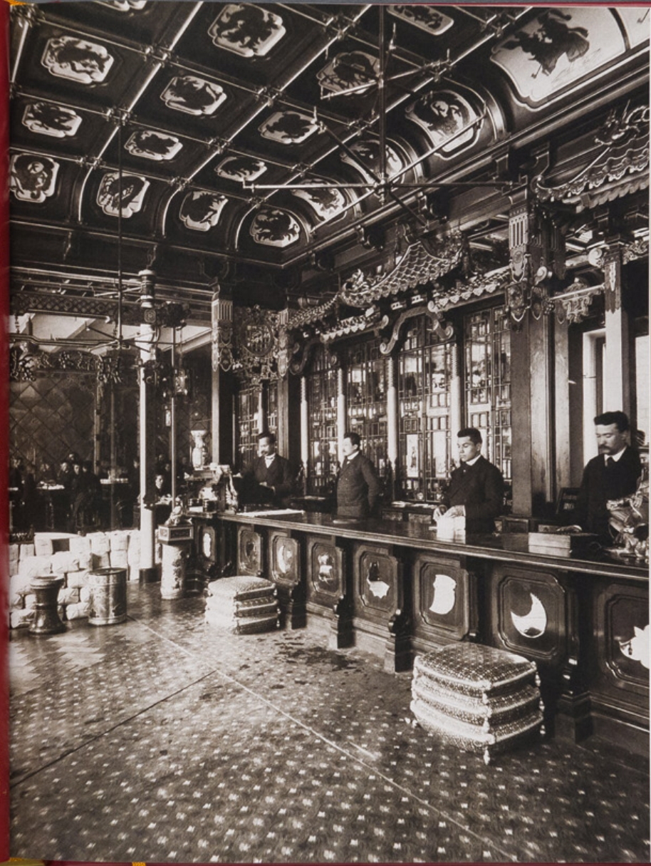
Чайный магазин С.В. Перлова в Москве 1900 г.