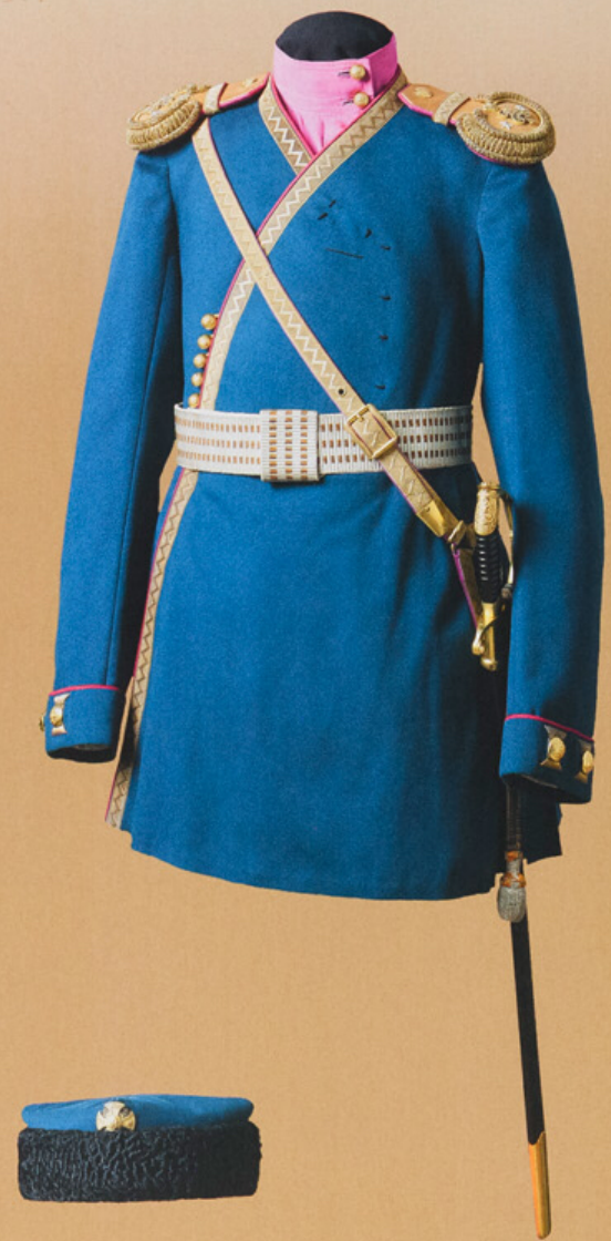
Комплект обмундирования, подаренный цесаревичу Алексею Николаевичу офицерами лейб-гвардии стрелкового Императорской Фамилии полка 30 июля 1911 г. Россия, 1911 г.