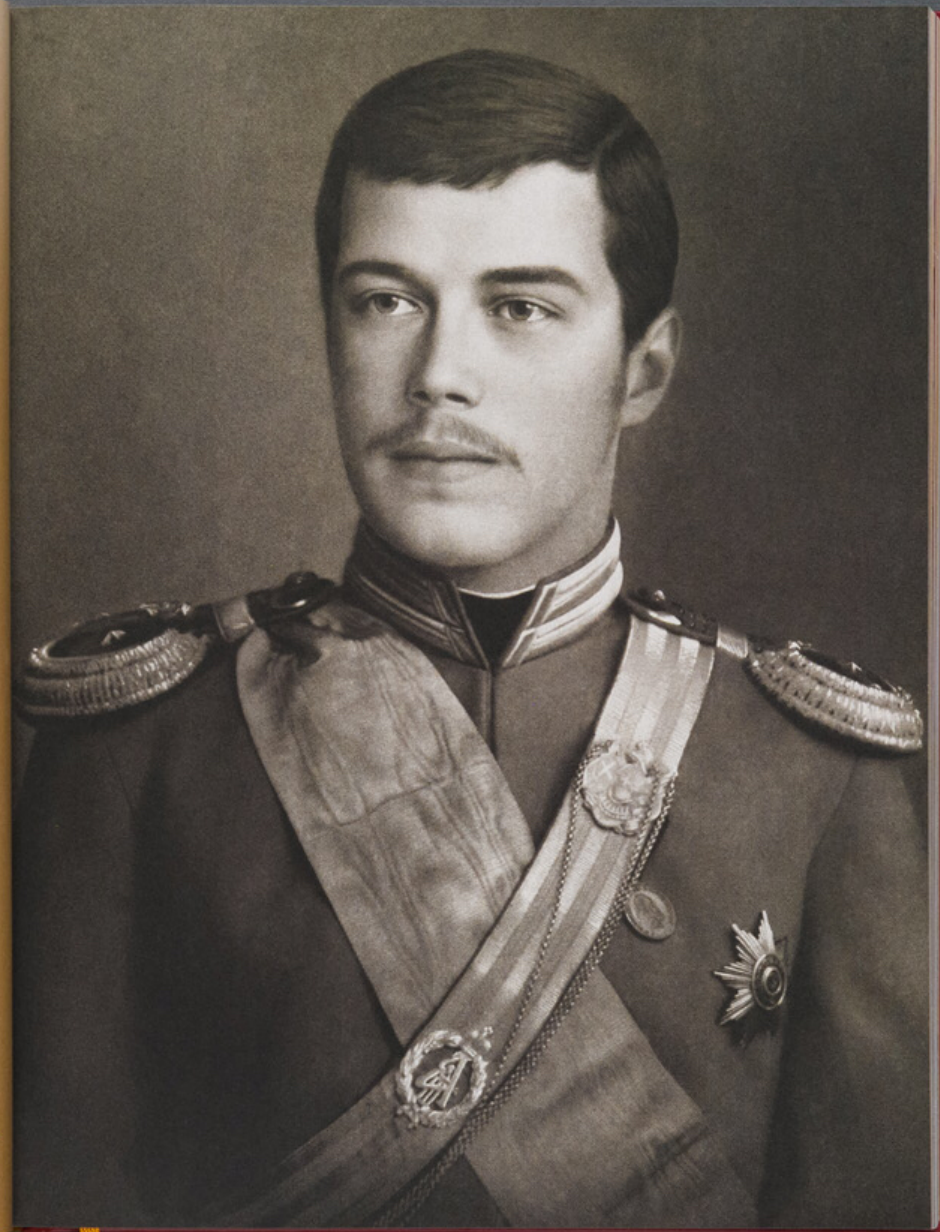
Портрет цесаревича Николая Александровича Конец XIX в. элемент

Из воспоминаний великого князя Александра Михайловича