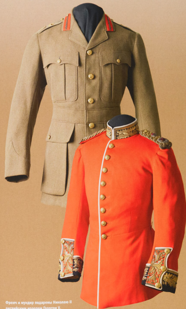
Френч фельдмаршалский посевенный Принадлежал императору Николаю II Англия (?). 1915-1917 гг.