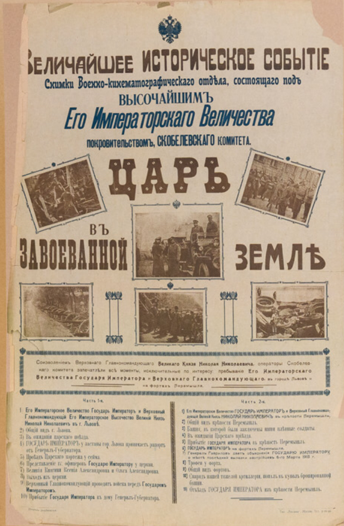
Плакаты «Царь в завоеванной земле» Военно-инженерно-графический отдел Скобелевского комитета. 1915 г.