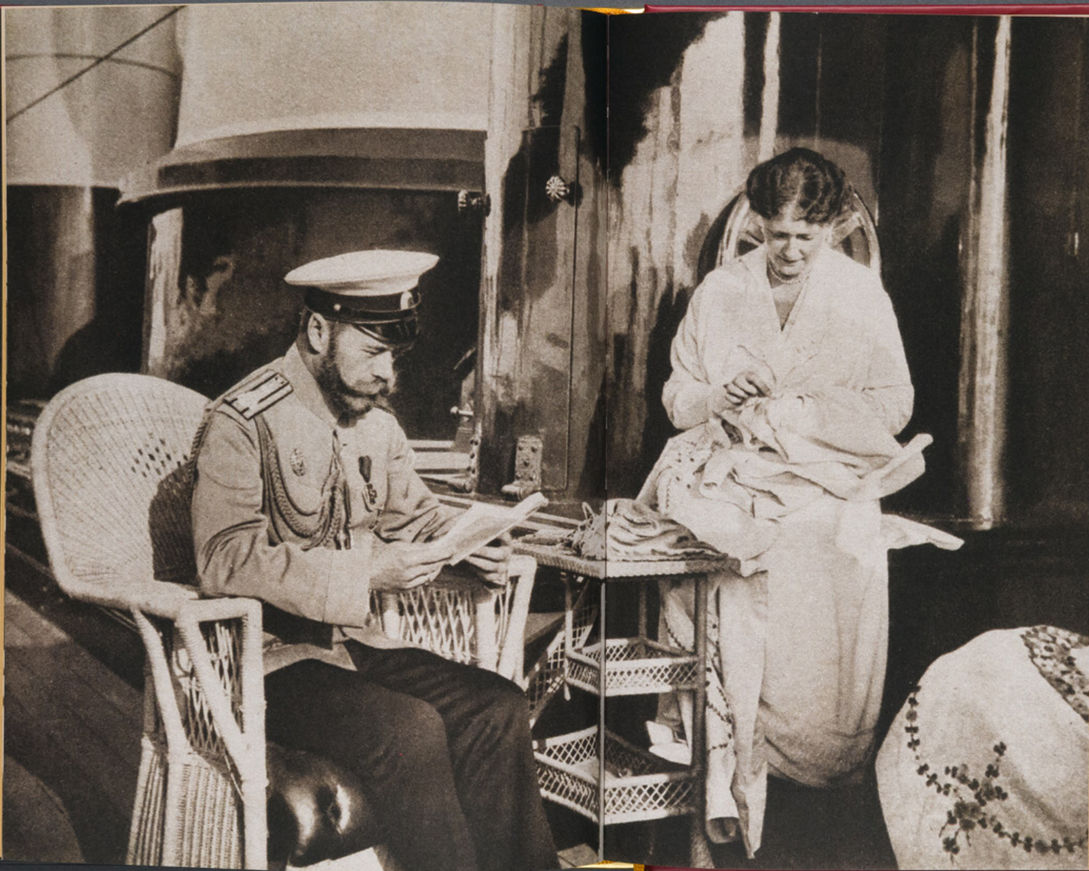
Император Николай II и императрица Александра Федоровна на яхте «Шандерг». Лист из альбома «Царская семья» Неизвестный фотограф, 1910-е гг.