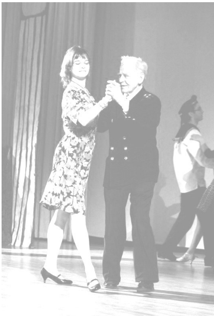
Вальс с офицером ГРУ.

Целый месяц и в особенности последнюю неделю я жила концертом ко Дню победы: читала сценарии и писала световую партитуру, учила тексты, танцы, пришивала пуговицы к гимнастерке, писала белые буквы, репетировала и видела во сне плясовую. О, это странное чувство, когда выползаешь из корпуса и в недоумении смотришь на часы на башне ГЗ. Что значит де-