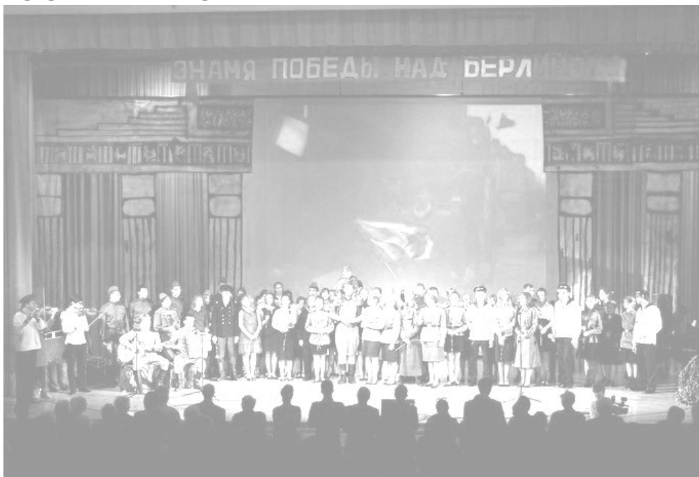
Финал концерта, исполняется песня "День Победы". Зал подпеваает стоя.