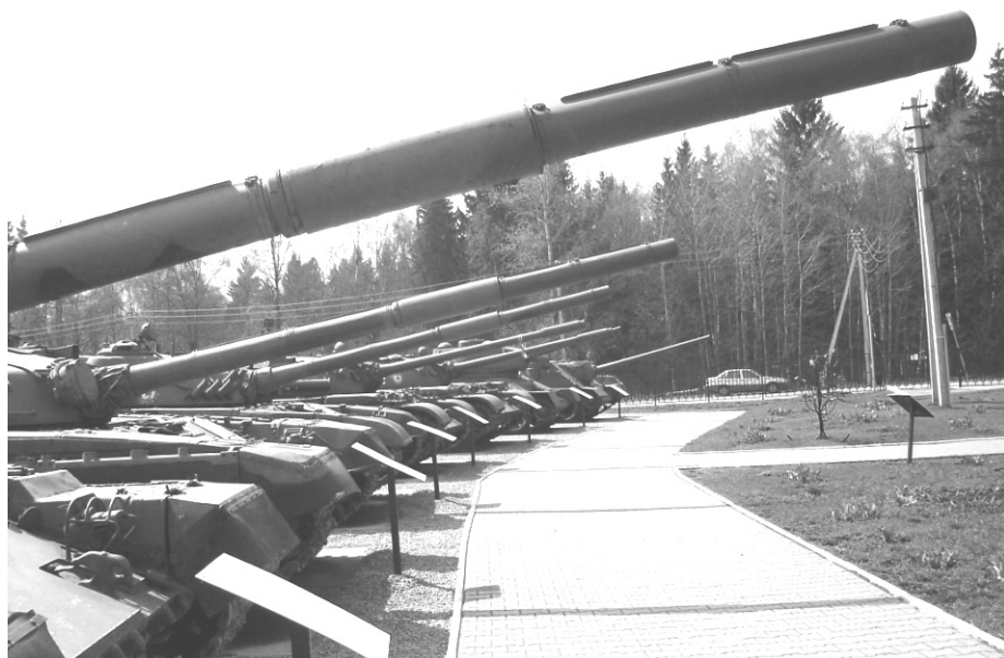
Многочисленное «потомство» Т-34

дим на станции Луговая и идём по направлению движения поезда. Дойдя до ж/д переезда, мы не переходим его, а поворачиваем направо. По дороге можно посмотреть на ветхие двухэтажные домики, способные смелостью архитектурных решений убить на месте слабого духом искусствоведа, а также посетить закусочную. Грешен, зайти и ознакомиться с меню не догадался.