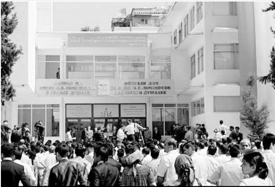
Открытие нового здания филиала МГУ в Душанбе

Будильник настырно звонит, вырывая из сладких объятий сна, в 7 часов утра. Это по местному времени, по московскому – только 6 часов. В первый день на новом месте, да еще после утомительной дороги, главная часть которой пришлось на четырехчасовой перелёт, встать непросто. Но что делать? Первая пара в филиале начинается в 8 часов. Да-да, дорогой читатель, это не опечатка, именно восемь часов. Более того, в такую рань собираются не только студенты и преподаватели, но и администрация. К примеру, изо дня в день, отправляясь на лекции, мы наблюдали, как не позднее 7 часов 50 минут открывался кабинет бухгалтерии, и его сотрудники рассаживались по рабочим местам. Душанбе вообще просыпается рано, соответственно, и отправляется на покой, что называется, засветло. Автор этих строк в последний день пребывания лихо радочно бегал вечером по центру столицы в безуспешной попытке купить открытки с видами Таджикистана. Киоски были закрыты, значительная часть магазинов тоже, на Центральном почтамте работала только телефонистка – сотрудники отдела почты разошлись. А ведь было